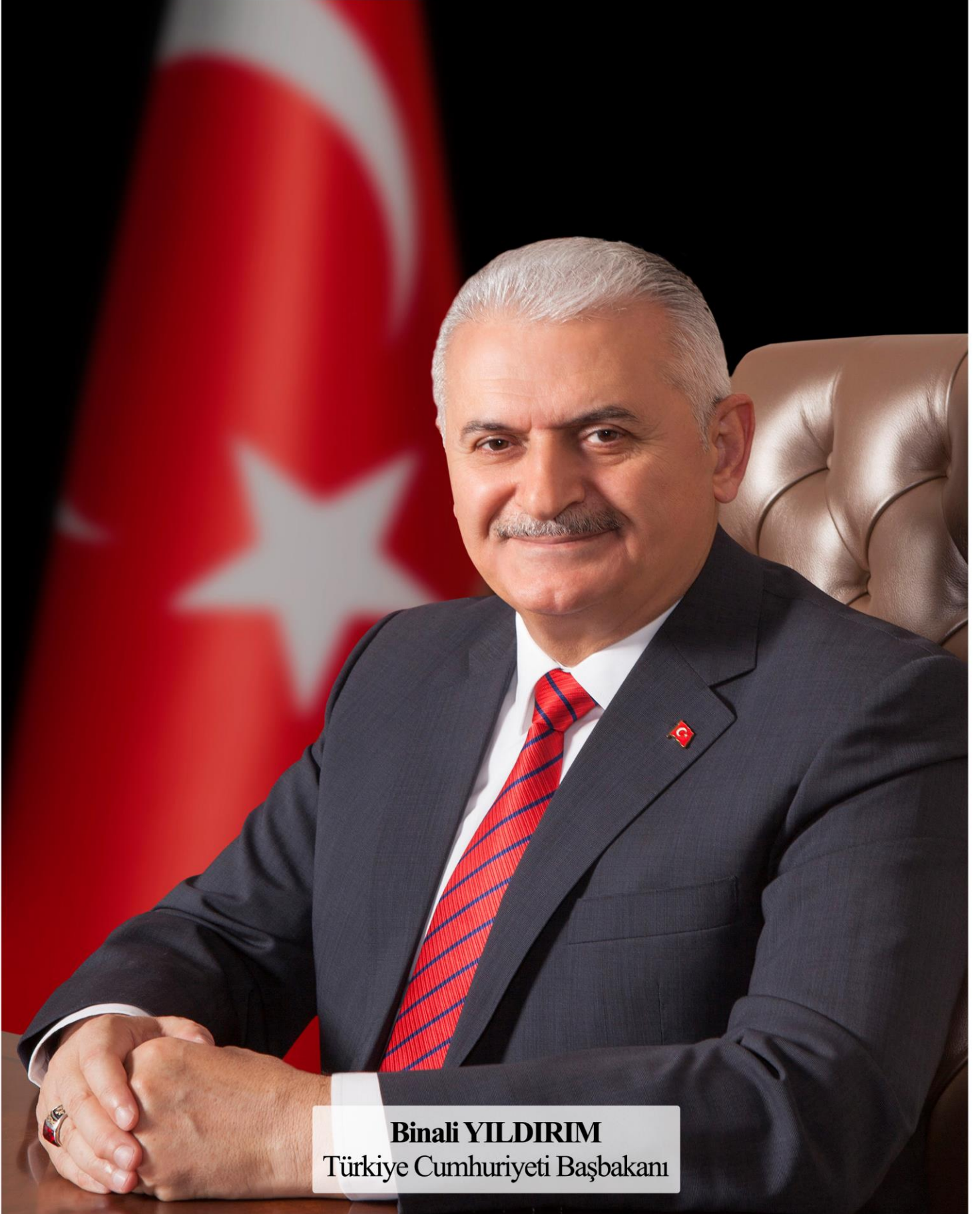
Binali YILDIRIM Türkiye Cumhuriyeti Başbakanı