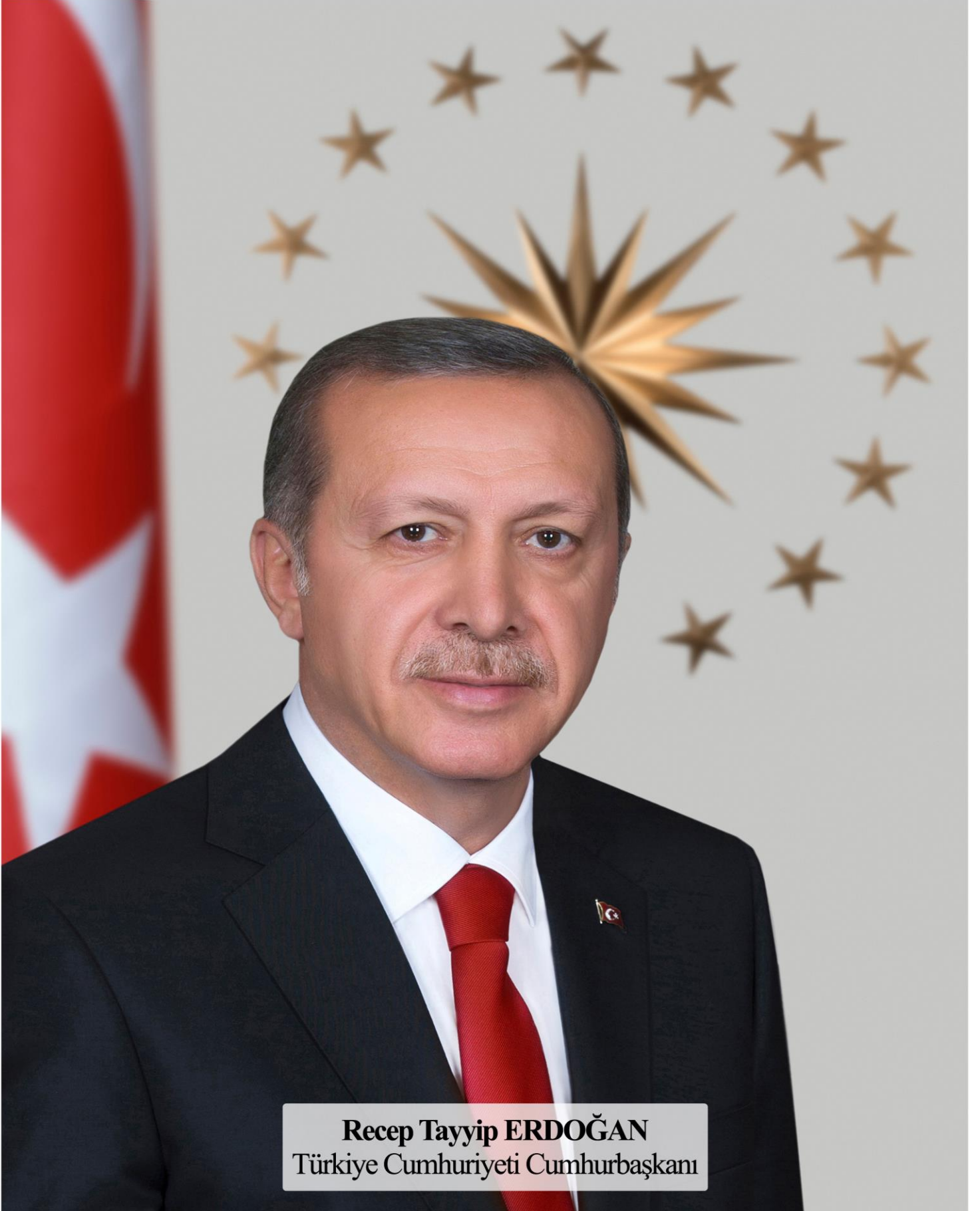
Recep Tayyip ERDOĞAN Türkiye Cumhuriyeti Cumhurbaşkanı