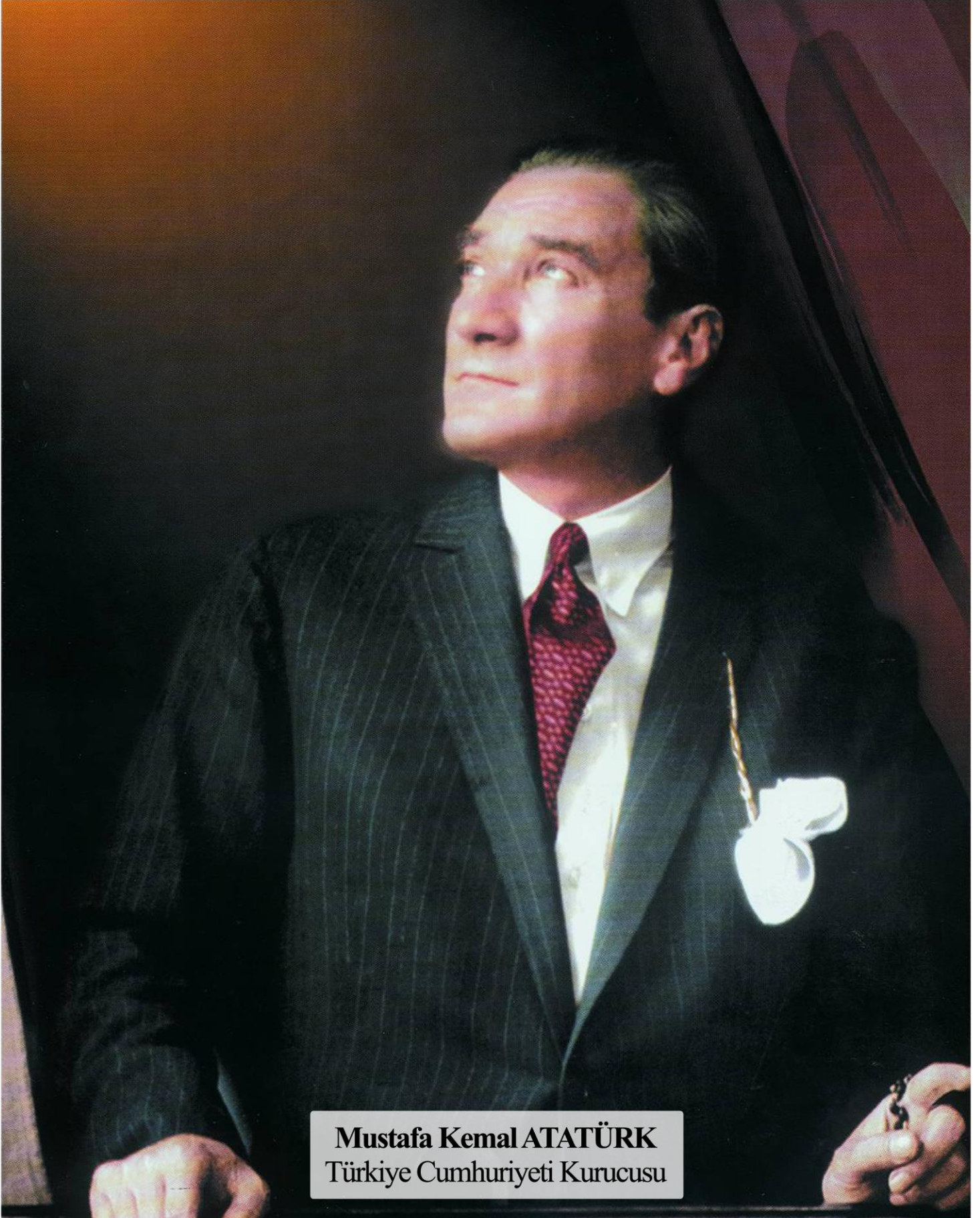
Mustafa Kemal ATATÜRK Türkiye Cumhuriyeti Kurucusu