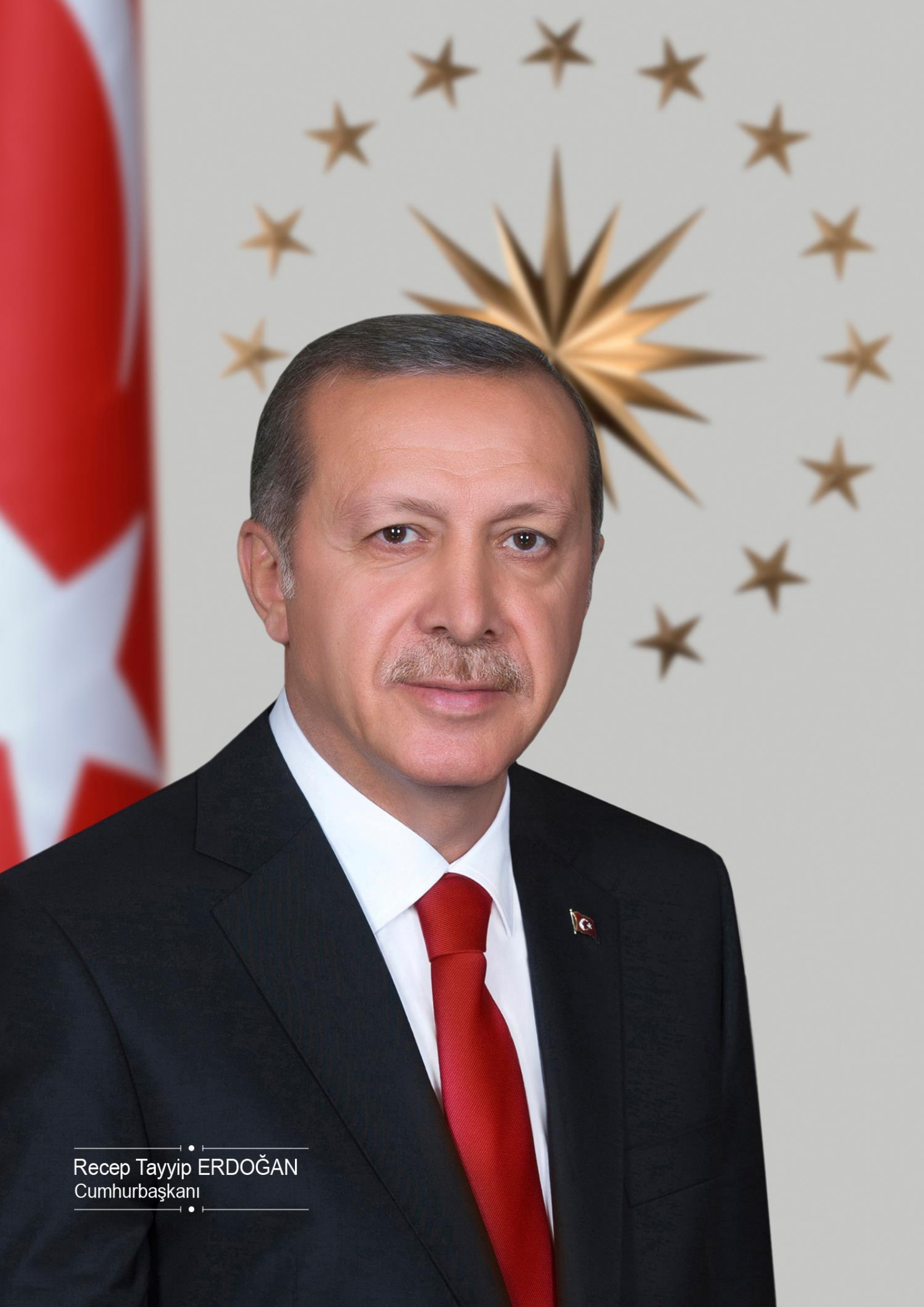
Recep Tayyip ERDOĞAN Cumhurbaşkanı