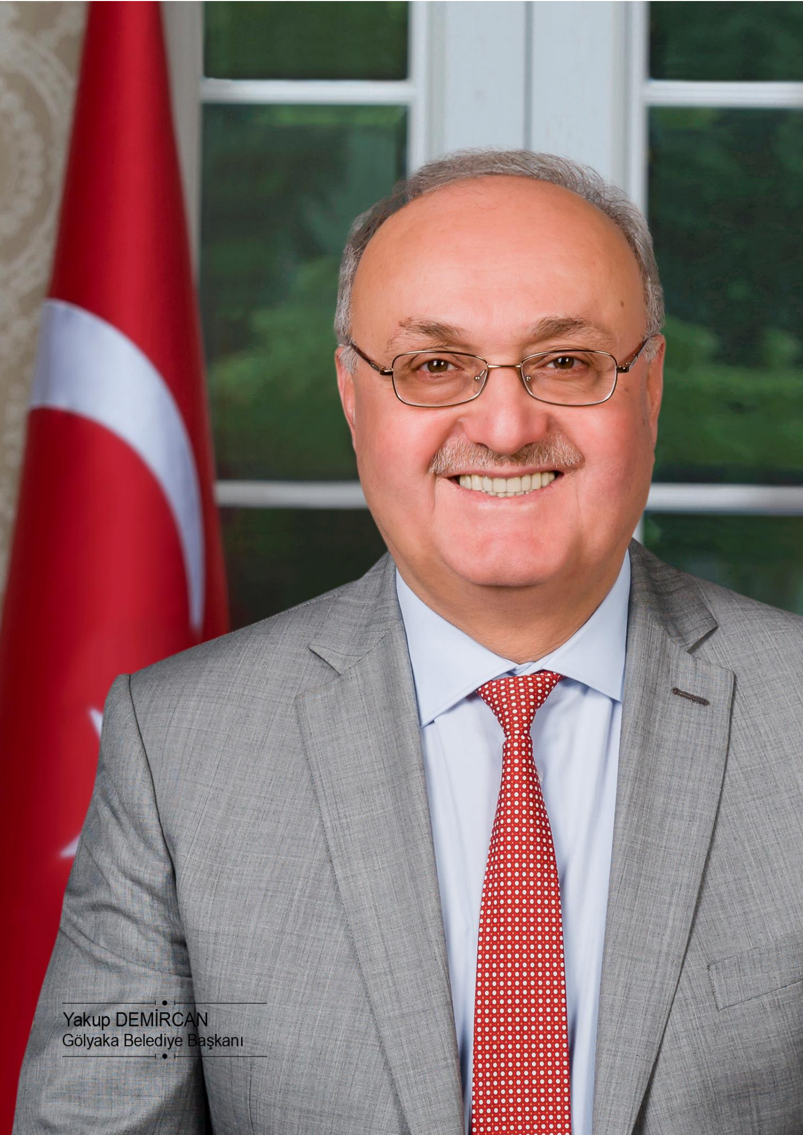
Yakup DEMİRCAN Gölyaka Belediye Başkanı